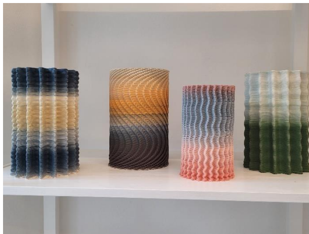
Hilda Piazzolla | Peach Corner 2021